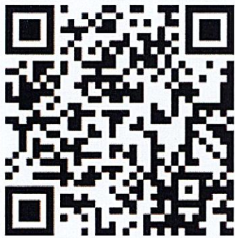
培训班报名 请用微信扫码报名

(二) 报名方式：为做好各项培训工作，请务必在 6 月 22 日 18:00 前微信扫描以下二维码完成报名。